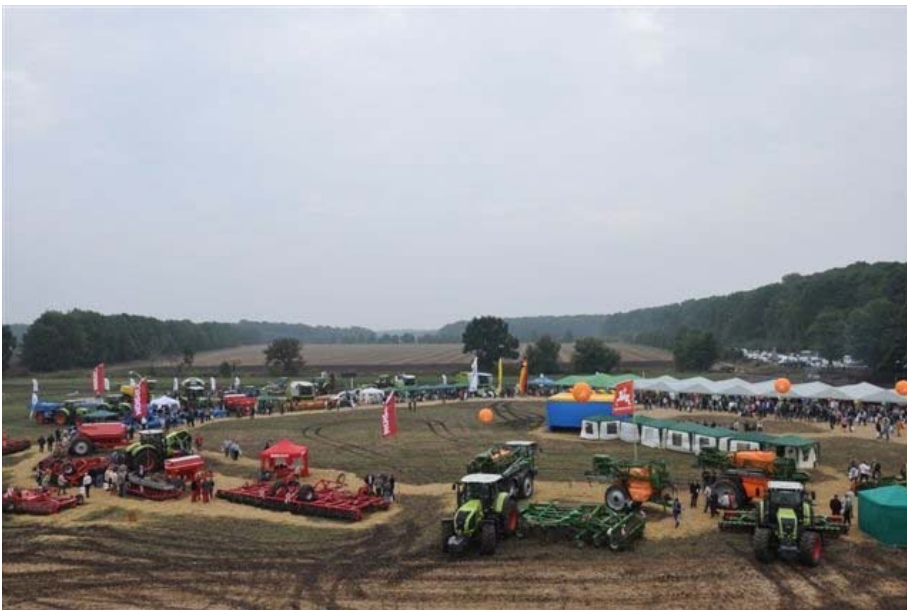
Abbildung 1: DAZ-Feldtag